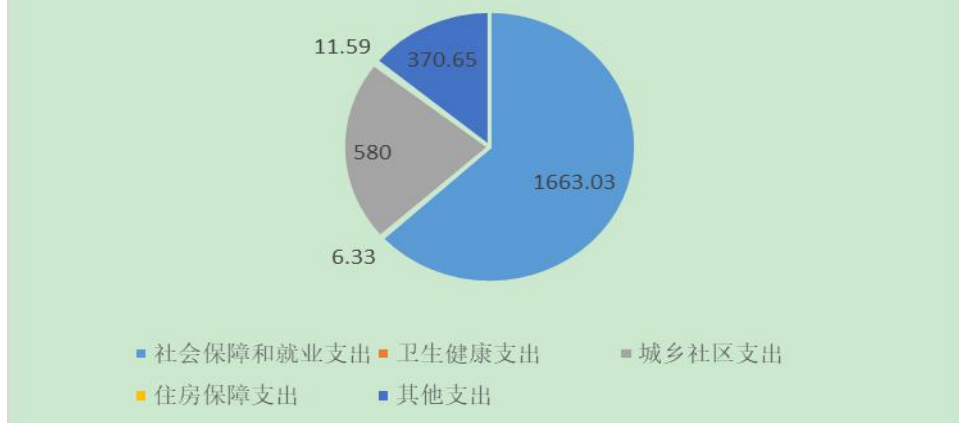
图4：财政拨款支出决算结构（单元：万元）